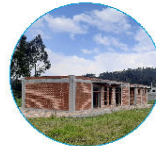
AULAS DE CAPACITACIÓN CARLOS GAVILANES