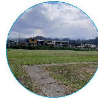
CANCHAS CARLOS GAVILANES