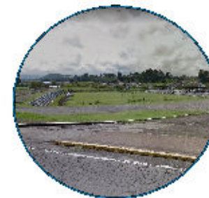
POLIDEPORTIVO DE RUMIÑAHUI