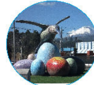
MONUMENTO EL COLIBRÍ