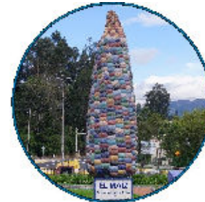
MONUMENTO EL MAÍZ