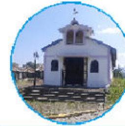
ALOJAMIENTO TEMPORAL SAN ANTONIO DE PASOCHOA