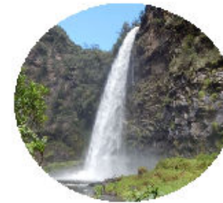
INGRESO CASCADA CONDOR MACHAY